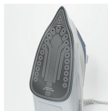
Base Cerâmica Ultra Glide