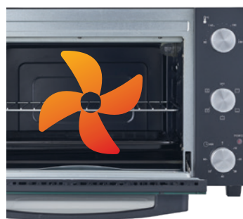
Função Grill/ Convecção