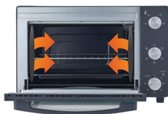
Revestimento Antiaderente Easy Clean

EAN: 5601545015105 | 1 unidade por caixa master